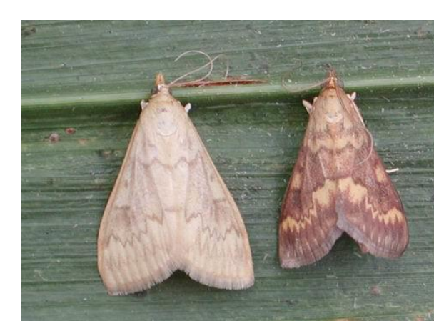
Adultes de la Pyrale - femelle à gauche - mâle à droite