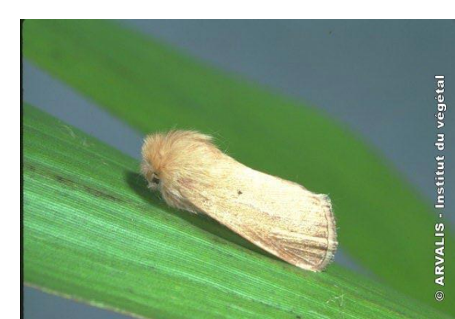
Adulte sésamie, les ailes antérieures sont brunes, les postérieures blanches