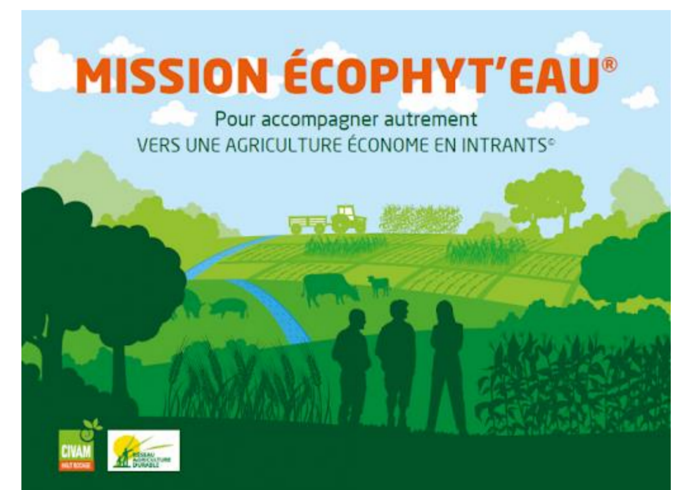
Le guide STEPHY et ses fiches