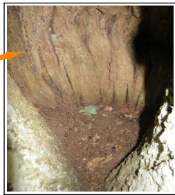
Intérieur d'une cavité à Pique prune