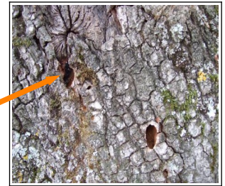
Indices de présence du grand Capricorne