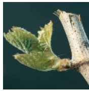
Sortie des feuilles