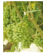
Fermeture des grappes