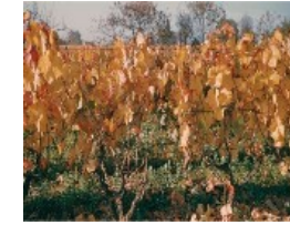
Chute des feuilles