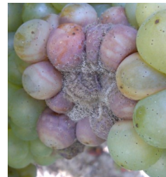
Botrytis = pourriture grise