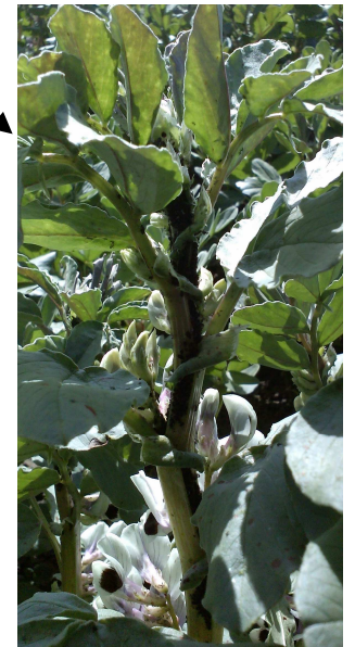
Manchon de pucerons noirs

Focus sur une alternative Désherbage mécanique possible si matériel disponible et implantation de la culture compatible